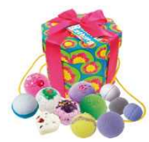
LUSH バスボム(入浴剤)3個セット

※平日ご来場のお客様には上記3種類からお選びいただけます (先着順 無くなり次第終了とさせていただきます)