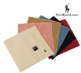
ラルフローレン タオルハンカチ3枚セット

この機会に是非ご来店いただきますよう ショールームスタッフ一同、心よりお待ちしております。 なお、ご来店の折には、大変お手数ですが本状を ご持参くださいますよう、お願いいたします。