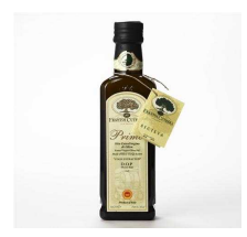
高級オリーブオイル 1本