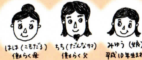
はは(こもだる) ちち(だんな) みゆ(娘) 偉らく母 偉らく父 平成10年生まれ

こもだる(強棒)とは葉(わら)の穂(こも)でくんだ酒樽のこと。 お酒を愛しすぎて自分のあだ名にしてみました。