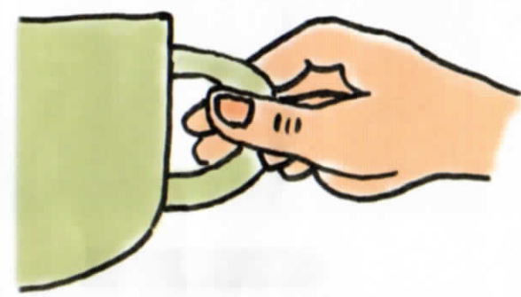
指の腹でつかんだ感覚

手の指の腹で物を持つ人が増えているようですが、ティーカップや本などを指の腹の場合、指先の場合とで、持ち比べてみましょう。→指先がどれだけ脳を活性化させるかが、わかるはずですよ。