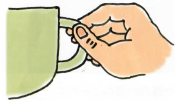
指の先でつかんだ感覚