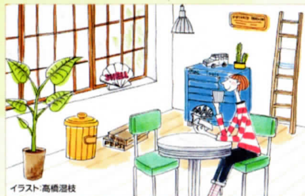
イラスト:高橋温枝

ガレージ+リビングのような、大人の遊び心を満たす空間づくりを取り入れてみてはいかがでしょうか。インナーガレージがあるお宅なら、車を保管するだけの空間から、手入れをする・眺める・楽しむ空間にリフレッシュして、居住性の高い“ガレージリビング”に。インテリアはアメリカンレトロスタイルのコーディネートがおすすめです。アイテムは、本物のビンテージものでなくても、アメリカの1950～1960年代のデザインやテイストを表現したものであれば雰囲気アップします。スチール製のパー